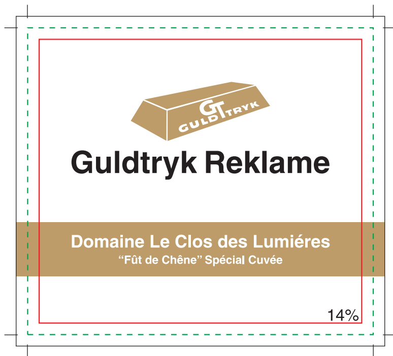
Forside etiket: 90x80 mm.